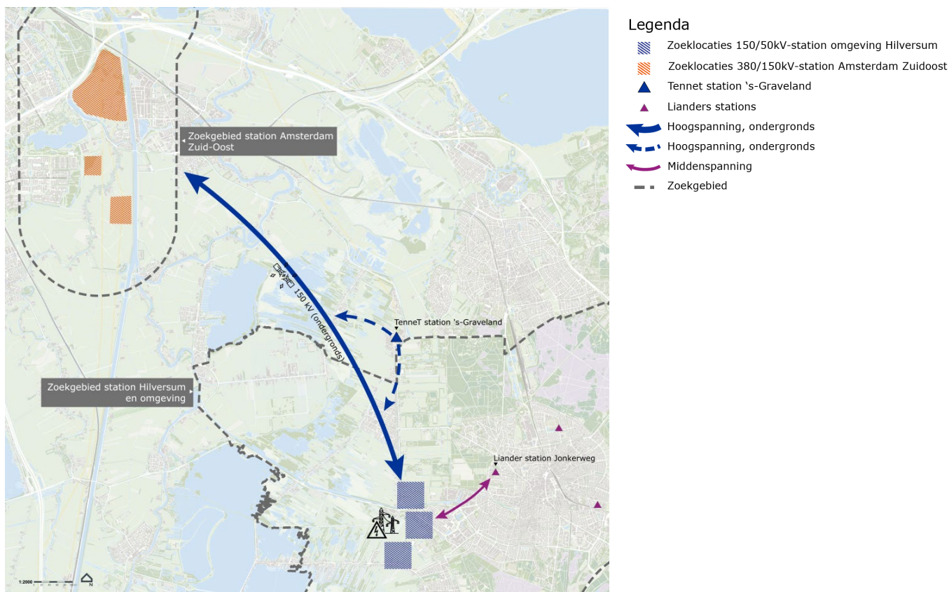
Figuur 4.1: Basiskaart zoekgebied station en tracés