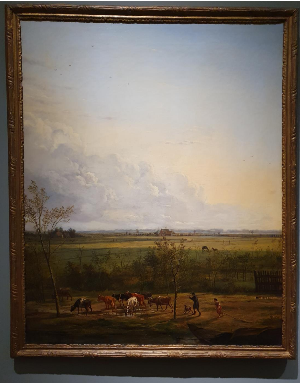
Vergezicht over de weiden bij 's-Graveland Pieter Gerardus van Os (1776–1839) olieverf op doek, 1817

Destijds was lang niet iedereen enthousiast over deze onopgesmukte landschappen en het verrassende perspectief. Een criticus keurde dit schilderij en dat van de 's-Gravelandse vaart af omdat Van Os de natuur niet mooier had voorgesteld. Nu beschouwen we de schilderijen als meesterwerken van de vroege 19de-eeuwse Nederlandse schilderkunst, juist vanwege de eigentijdse en originele visie op het Hollandse landschap.